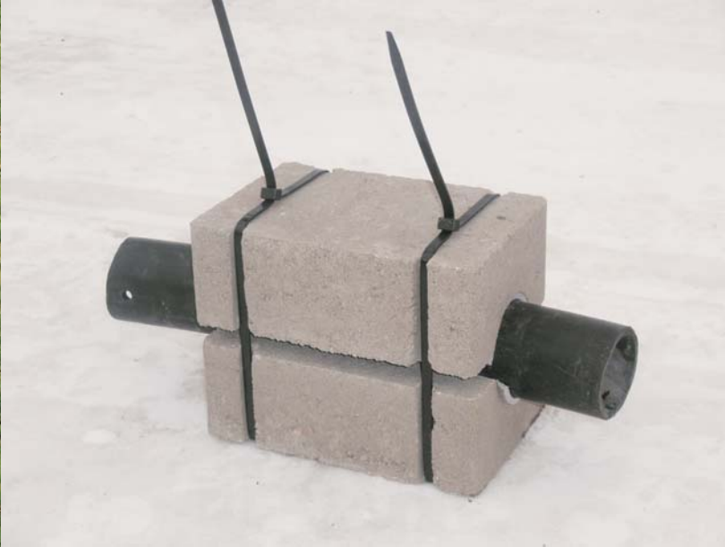
Nippusidepaino 50 ja 63 mm putkille, 6,8 kg

Lujabetoni Oy:n nippusidepainot on suunniteltu kaikenlaisten putkien vesistöihin upottamista varten. Käyttökohteita ovat mm. maalämpö-, vesijohto- ja viemäriputket.